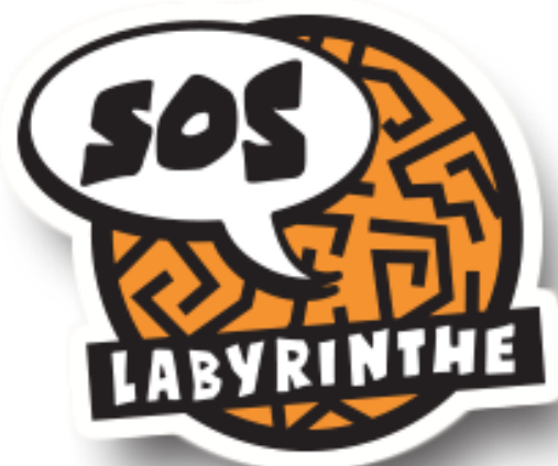
SOS Labyrinthe, Vieux-Port Montréal www.soslabyrinthe.com