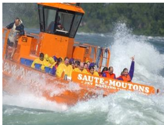
SAUTE-MOUTONS, Montréal www.jetboatingmontreal.com/