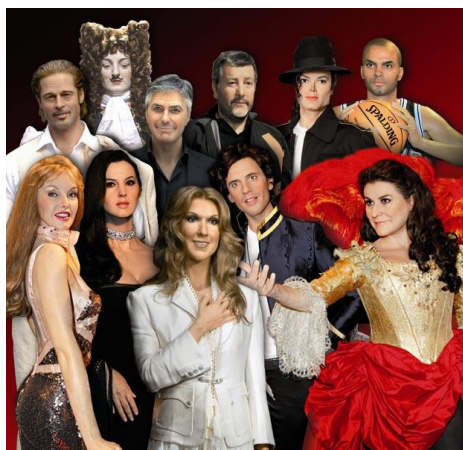
MUSÉE GRÉVIN, Montréal www.grevin-montreal.com