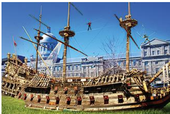
VOILES EN VOILES, Vieux-Port Montréal www.voilesenvoiles.com/activite/#parcoursaeriens